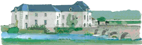
Ilustraciones y concepto gráfico: Hélène Charron

En el centro de la explanada, se levanta el monumento levantado en 2013, que evoca a la vez la expansión de la congregación de los hermanos de San Gabriel en 32 países, y su misión, resumida en las tres palabras esculpidas sobre el zócalo de la fuente: enseñar, educar, evangelizar.